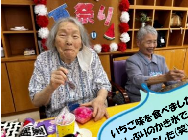
いちご味を食べました。久しぶりのかき氷でキーンとなりました(笑)

いよいよ本格的な夏がやってきました！今年もアイスビスでは夏の風物詩を楽しんでいただけました。焼きそばやたこ焼き、チョコバナナなど屋台風のメニューは好評で、皆さま笑顔いっぱいでした。ゲームコーナーでは、金魚すくいやヨーヨー釣り、射的など大きな盛り上がりを見せました。最後は地域の婦人会の皆さまと益城音頭を楽しみ、音楽に合わせて身体を動かすひとときに、皆さま自然と笑顔があふれていました。